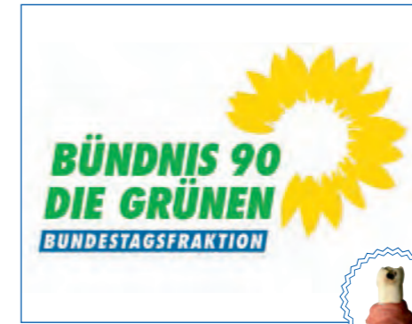
Bundestagsfraktion Bündnis 90 Die Grünen

Mit der zweiten Aussage liegt die Sprecherin der Grünen sogar richtig. Schließlich werden die Patienten von diesem Gesetz zur angeblichen Stärkung ihrer Rechte gar nicht profitieren, weil zusätzliche bürokratische Hürden die Abläufe unnötig verkomplizieren werden und so